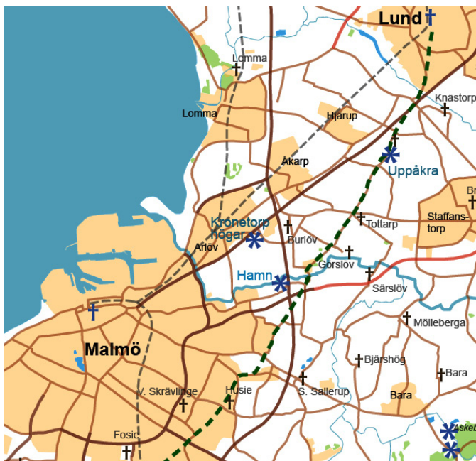
Karta över området mellan Malmö-Lund med några av de platser som omtalas i artikeln inlagda.

att 220 lass sten kördes därifrån och 3400 lass jord. Denna mängd av sten är anmärkningsvärd. Detta tyder nämligen inte på att det varit frågan om en vanlig skånsk bronsåldershög. Dessa högar har ju i princip endast stenar i kantkedja runt högen samt i själva gravkammaren. Det berättas också att när man kommer 4 alnar i den 10 alnar höga högen befanns där "en stenlagd plan" . Detta tyder snarare på en järnåldershög med en inre kärna som täckts av stenar, en hög av typen Anunds hög i Västmanland och andra högar från yngre järnåldern.