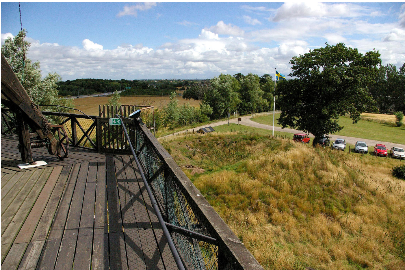
Utblick från Kronotorps mölla mot norr. Till höger ses den kvarvarande gravhögen med plundringshål i toppen.